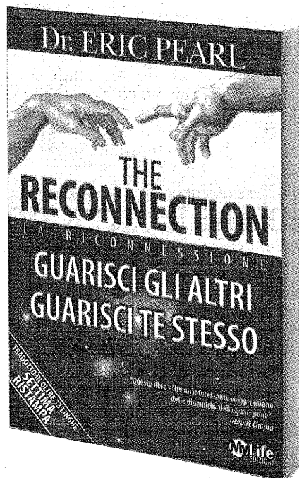
Il libro di Eric Pearl, best seller, tradotto in oltre 36 lingue "The Reconnection", edito in Italia da Edizioni My Life.

dalla sua prima visita, il tutto accadde per caso. «La notte di un week-end mi svegliai vedendo una luce molto intensa e, allo stesso tempo, percepii una presenza in casa tanto che scesi al piano di sotto per controllare cosa stesse accadendo. Non notai però nessuna presenza tanto che mi rimisi a dormire pensando si trattasse di un sogno, di semplice immaginazione. Il lunedì, in studio, 7 pazienti che non sapevano nulla di quanto mi era accaduto, né di quanto fosse successo a ciascuno di loro, mi dissero di avere vissuto la stessa esperienza e affermarono che potevano sentire le mie mani muoversi su di loro anche se non li toccavo