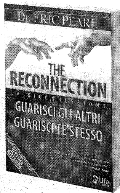
Il libro di Eric Pearl, best seller, tradotto in oltre 36 lingue “The Reconnection”, edito in Italia da Edizioni My Life.

nell'anno 2010 si era recato nella città di Riviera per un'edizione del medesimo seminario, ripetuto, come più volte sottolinea l'autore, in città di tutto il mondo. Il pubblico di tali sessioni di dimostrazione pratica e trasmissione della conoscenza è composto per il 20% da professionisti provenienti dall'ambito medico, nonché da ricercatori, studiosi e naturalmente gente comune. Eric Pearl e il suo staff di 140 praticanti che lo sostengono nell'attività dell'insegnamento (quattro di questi sono italiani) sono spesso oggetto della curiosità non solo di chi entra in contatto con la pratica ma anche dell'ambiente